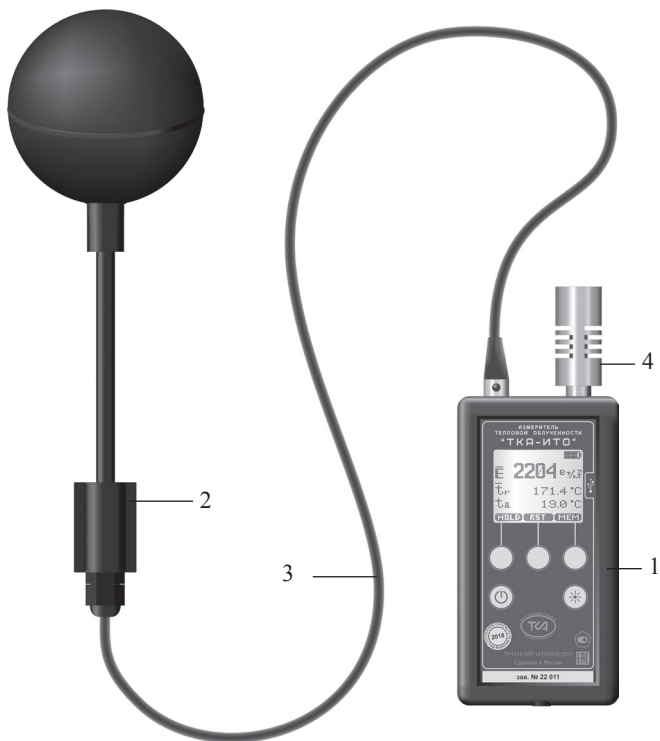
Рис.1 – Внешний вид прибора “ТКА-ИТО”.